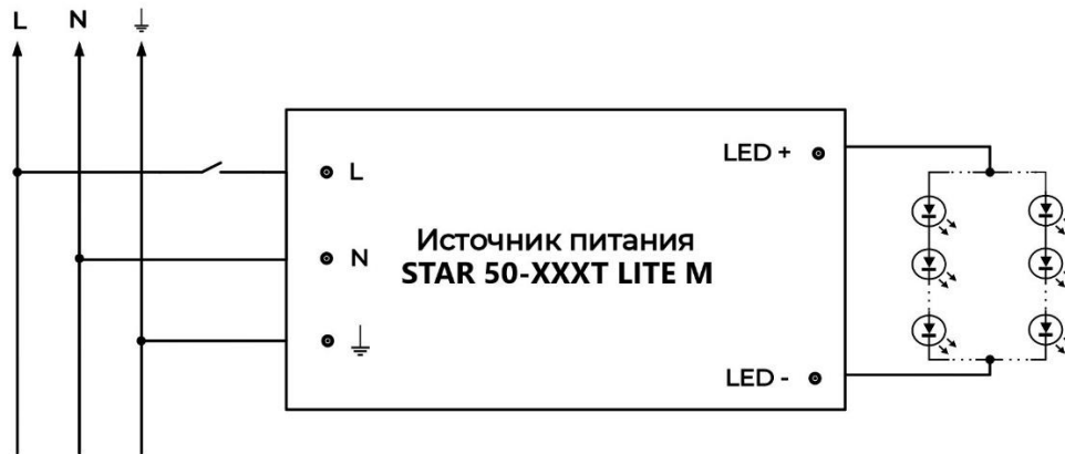
Рисунок 3 – Схема подключения

4.6 Отключение источника должно производиться в обратной последовательности: отключить сеть, LED – модуль.