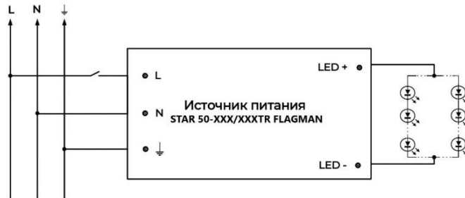
Рисунок 2 – Схема подключения